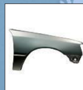
Piezas de carrocería