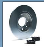
Sistemas de frenado